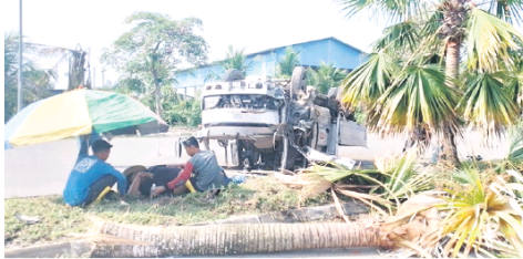
TERBALIK: Lori terbabas lalu melanggar pokok di bahu jalan di Jalan Tanjung Manis semalam.

"Mangsa yang cedera telah dikeluarkan oleh orang awam sebelum ketibaan pihak bomba,"