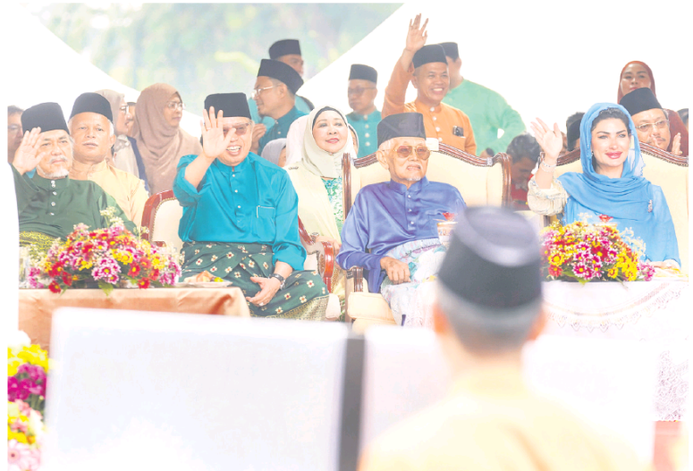
MESRA: Tetamu kenamaan melambai ke arah kontinjen yang melakukan lintas hormat di hadapan pentas utama pada majlis berkenaan.

"Amalan toleransi ini dapat dilihat dengan jelas ketika Nabi Muhammad SAW setuju