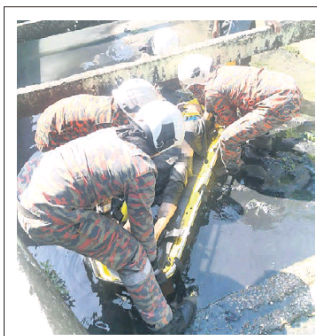
HATI-HATI: Pasukan bomba cuba membawa keluar mangsa yang terjatuh di Miri, kelmarin.