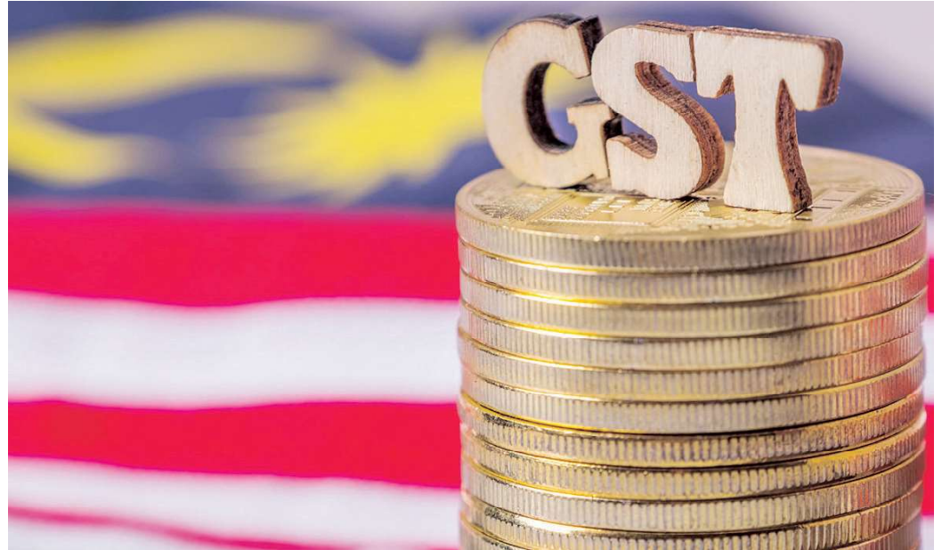
Sekiranya GST diperkenalkan semula di Malaysia, kebergantungan kepada cukai korporat dapat dikurangkan dan sekali gus mempelbagaikan hasil pendapatan negara.

Pada masa yang sama, kebergantungan Malaysia kepada cukai korporat adalah tinggi. Jika dibandingkan dengan negara-negara lain di